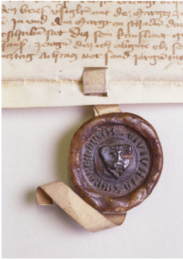
Das älteste im Stadtarchiv erhaltene Märktseigel 1428