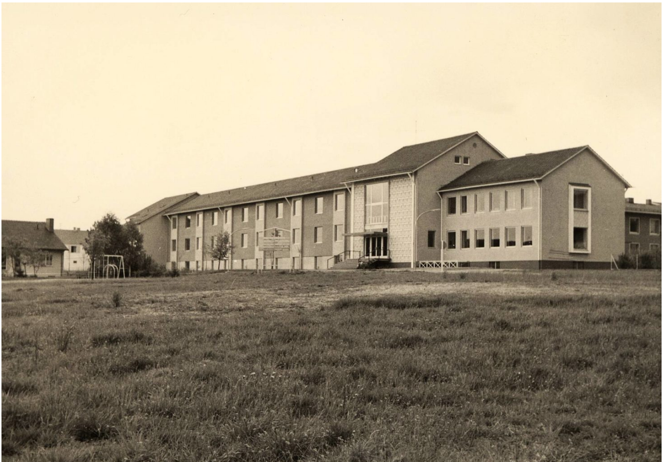
Der Neubau des Gymnasiums Schrobenhausen steht wenige Jahre nach der Eröffnung 1963 noch auf der „grünen Wiese“

Der Zustrom zur Schrobenhausener Oberrealschule war groß, zumal viele vergleichbare Nachbarstädte erst viel später eine höhere Schule erhielten. So kamen bis zur Hälfte der Schüler aus benachbarten Landkreisen, vor allem aus dem Landkreis Aichach. All das führte bald zu sehr unbefriedigenden Schulverhältnissen: Einzelne Klassen mussten ausgelagert werden, Schichtunterricht war über viele Jahre die Regel. Erst nach der Verstaatlichung der Schule im Jahr 1960 konnte mit einem Neubau begonnen werden, im Jahr 1961 bezog die Oberrealschule diesen Neubau an der Michael-Thalhofer-Straße.