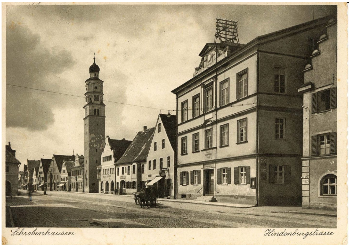
Diese historische Postkarte, die vermutlich nicht allzu lange nach 1900 entstand, zeigt das aufgestockte Schulhaus

Die Ordensschwestern konnten jedoch schon bald das Rentamtsgebäude – das ehemalige Spital – erwerben und gründeten dort eine eigene Niederlassung ihres Ordens. Es folgte der Ausbau der Gebäude, so dass die Mädchenschule nun in den Bereich der heutigen Mädchenrealschule verlegt werden konnte, die Knabenschule kehrte im Jahr 1865 in das Schulhaus an der Poststraße zurück und blieb dort viele Jahrzehnte.