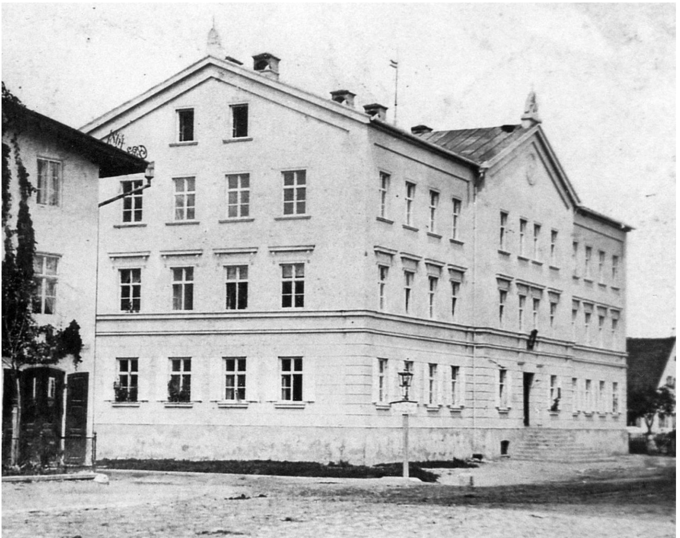
Das städtische Armenhaus, später Knabenschule, heute Verwaltungsgebäude Regensburger Str. 5, in einer historischen Aufnahme

zu erhöhen: Es erhielt die heutige äußere Form. Die Baumaßnahmen wurden 1890 abgeschlossen, man konnte durch den Umbau drei zusätzliche Unterrichtsräume gewinnen. Doch auch diese Erweiterung reichte nicht lange aus: So wurden bereits im Jahr 1906 Unterrichtsräume in das Armenhaus (das heutige Verwaltungsgebäude Regensburger Str. 5) ausgelagert. Immer mehr Unterrichtsräume entstanden nun hier, so dass nach dem Ende des Ersten Weltkriegs die Knabenschule ganz ins Armenhaus verlegt wurde und 1921 die neu gegründete Landwirtschaftsschule ins ehemalige Knabenschulhaus einzog. Einzelne Räume wurden aber – bei Bedarf – immer wieder anderen Schrobenhausener Schulen überlassen, so der Knabenschule, der Berufsschule, später auch der 1938 gegründete Oberschule, das spätere Gymnasium. Unmittelbar nach Kriegsende waren amerikanische Soldaten im Schulgebäude einquartiert.