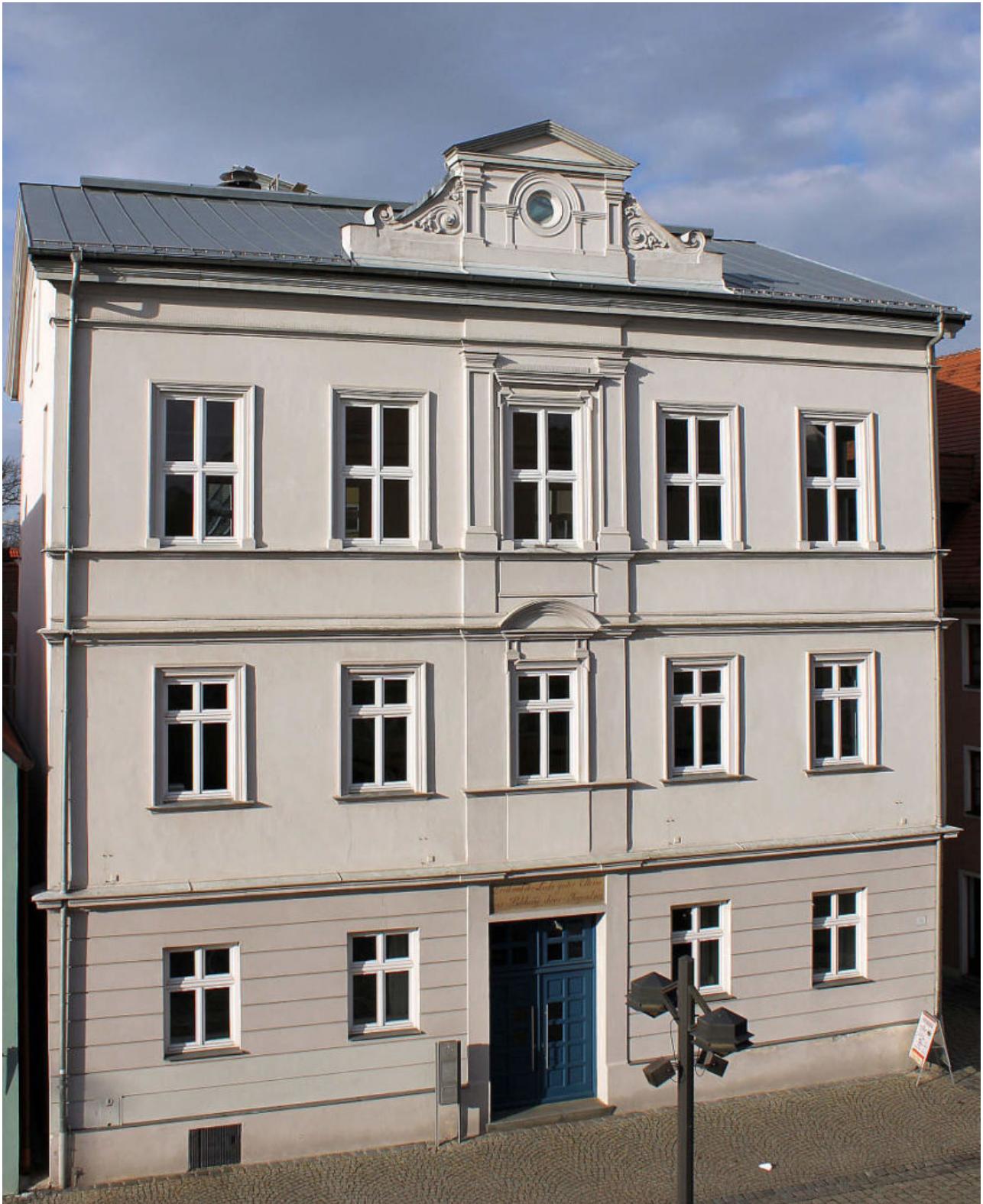
Das Gebäude als vhs-Haus im Zustand des Sommers 2014

Genau 175 Jahre sind vergangen, dass der Umbau aus einem Wirtshaus zur damals so hochgelobten Schrobenhausener Schule fertiggestellt wurde. Seither ist das Gebäude fast ausschließlich für – ganz unterschiedliche – Bildungszwecke verwendet worden. So spiegelt das jetzige Gebäude der Volkshochschule auch die wirtschaftliche und gesellschaftliche Entwicklung dieser Zeit wider: Nämlich über die steigenden