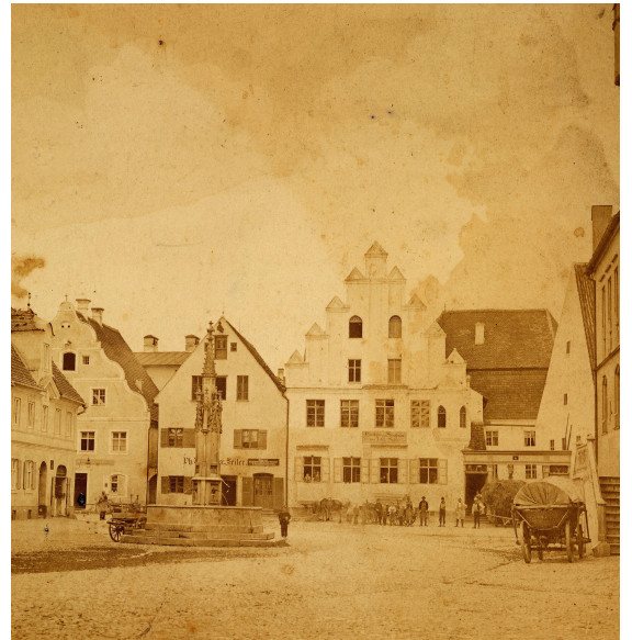
Bildarchiv - Marktplatz um 1880