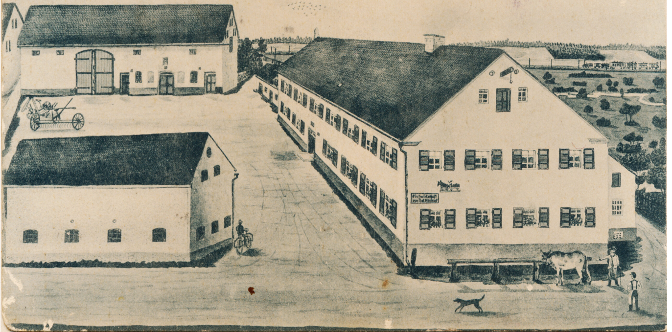
Gastwirtschaft Paul Manhart, Lithographie (geschätzt 1900 bis 1910, ausgeschnittene Ecke links oben mit Photoshop ergänzt)