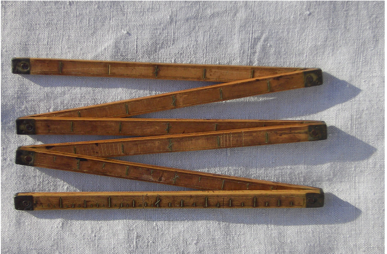
Zollstock 1801 (Schrobenhausener Stadtmuseum) Man erkennt die Einteilung in Halb- und Viertel-Zoll

Altes Rathaus in Regensburg: „der stat schuch / der stat öln / u. der stat klafter“