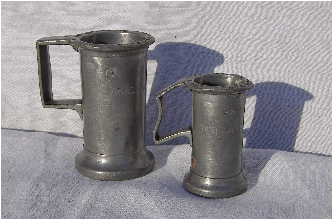
Zinnmaße 1851 –Eichmarken auf dem oberen Rand

Schrobenhausen, Rain am Lech, Mühlried, Pfaffenhofen: Vier Orte, die man als beispielhaft annehmen kann, haben vier verschiedenen Kornmaße: Man kann ermessen, wie schwerfällig das Wirtschaftsleben im Lande funktionierte. Bis zu einer wirkungsvollen Abhilfe dauerte es noch bis zur Reichsgründung.