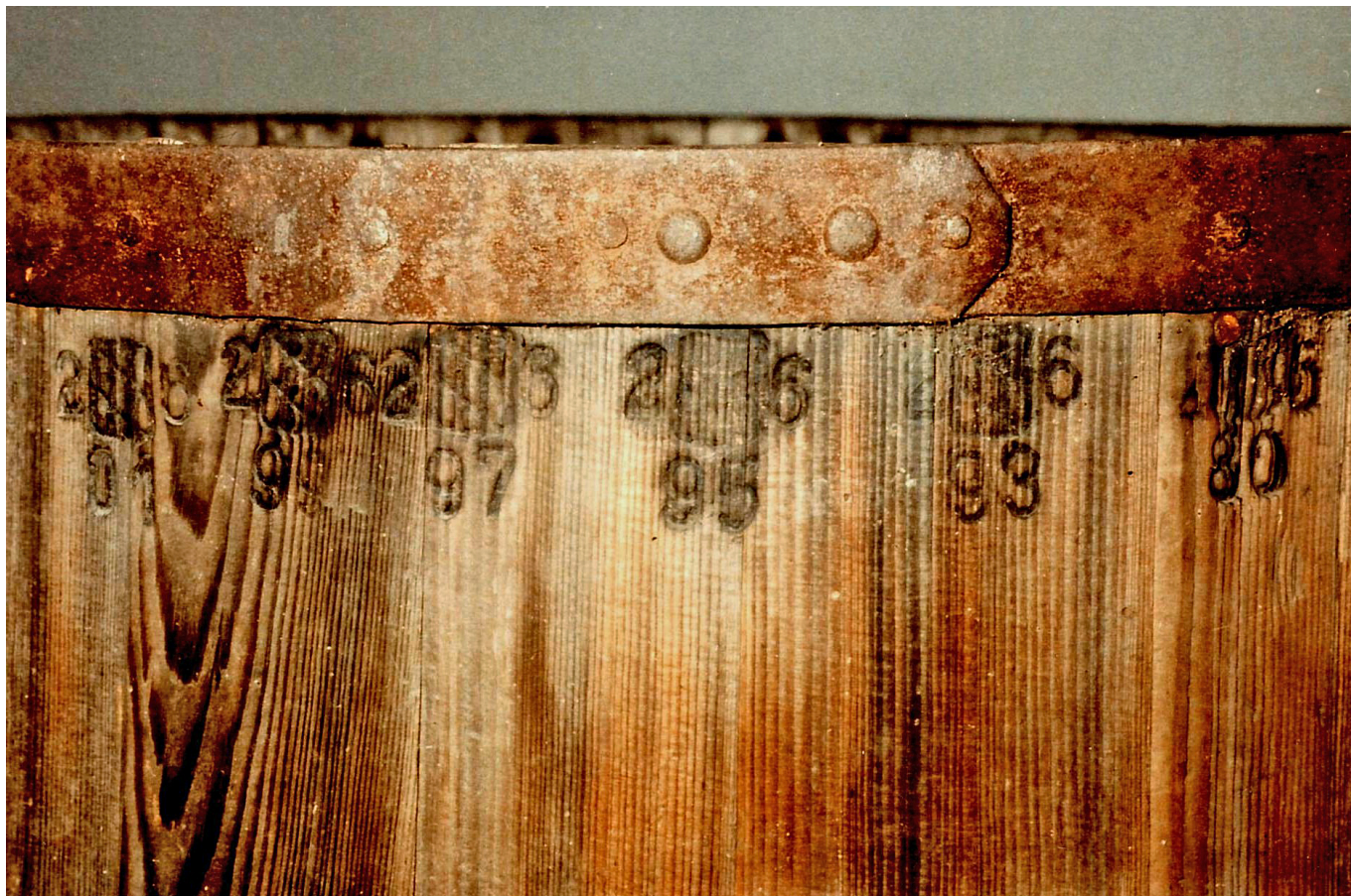
Schaff aus dem Besitz des Melbers und Salz-Stößlers Georg Mühlbauer mit Eichmarken von 1880 bis 1901 am oberen Rand

Das mit dem Mandat von 1731 verordnete Münchner Getreidemaß ist der Münchner Schäffel , der 6 Münchner Metzen enthält. Der Metzen hat 4 Viertel . Weitere Unterteilungen des Metzens gehen hinab bis zu 32 Dreißigern und 128 Mässeln in einem Metzen.