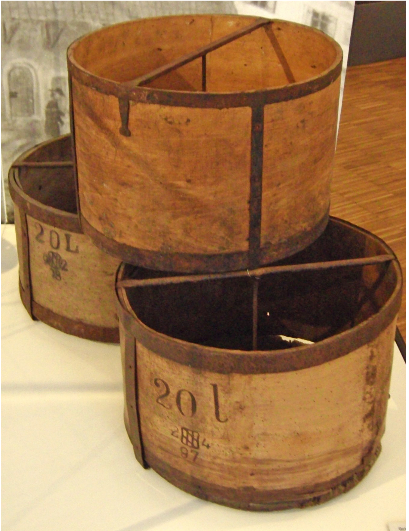
Getreidemaße nach 1872 – in Litern vermessen und geeicht (Stadtmuseum Schrobenhausen)