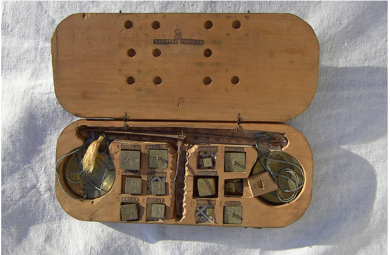
Feinwaage zur Münzprüfung 1856 (Stadtmuseum Schrobenuhausen)

Als zweites spezifisches System gab es das Apothekergewicht , dessen Anwendungsgebiet sich aus dem Namen ergibt. Das Apothekerpfund entsprach etwa 360 Gramm und war unterteilt in 12 Unzen, 96 Drachmen 288 Skrupel und 5760 Gran .