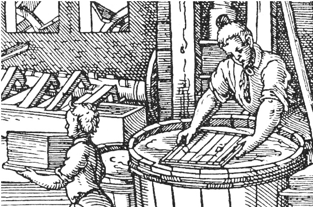
„Der Papyrer“ (Ausschnitt, aus Jost Ammans Ständebuch 1568)

Papiermüllern an. Der Rohstoff wurde zerkleinert, eingeweicht und dann in einem Stampfwerk zerstoßen, das durch Wasserkraft angetrieben wurde. Der verdünnte Faserbrei wurde in Bütten – Holzbottiche – gegeben, von dort wurden die Bögen mit einem Sieb „geschöpft“ und anschließend getrocknet. Das so hergestellte Papier war im Vergleich zur heutigen Zeit sehr teuer, ist aber extrem widerstandsfähig.