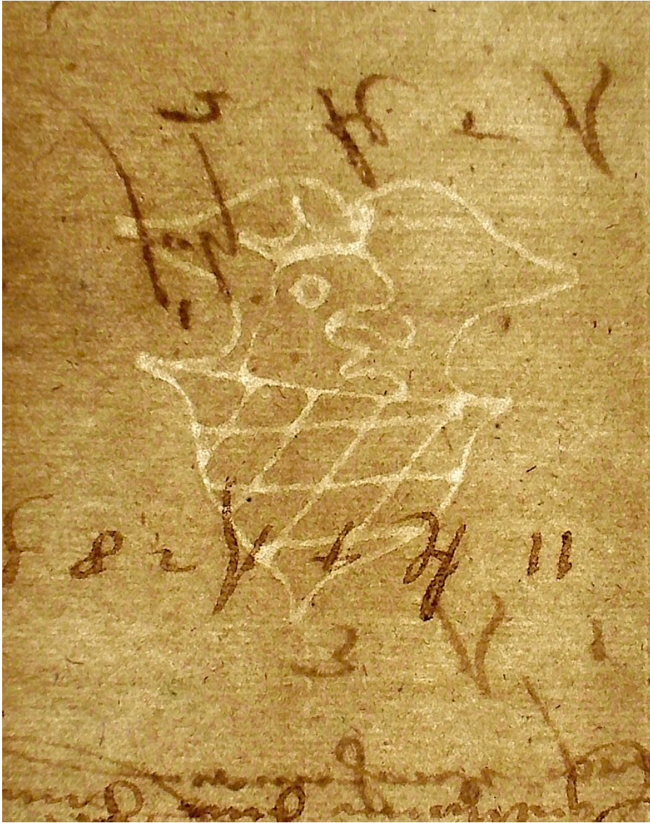
Frühes Schrobenshausener Wasserzeichen aus dem Jahr 1544