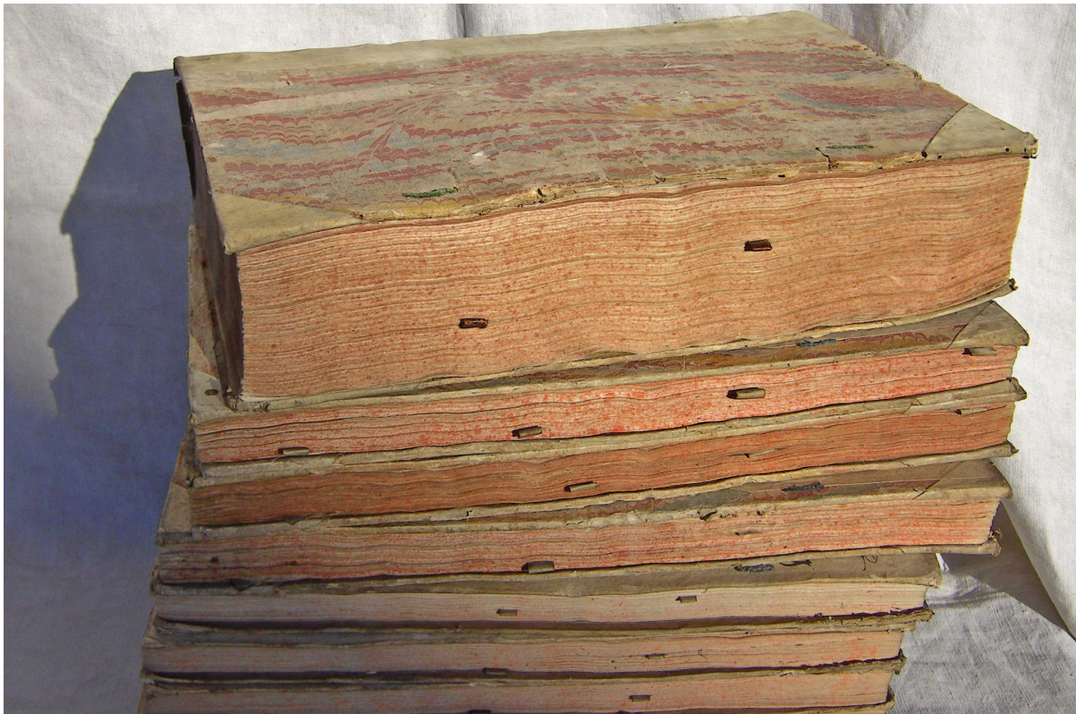
Schrobenhausener Stadtkammer-Rechnungen aus dem 18. Jahrhundert

B[ernhard] Hausmann: Albrecht Dürer's Kupferstiche. Radirungen, Holzschnitte und Zeichnungen, unter besonderer Berücksichtigung der dazu verwandten Papiere und deren Wasserzeichen, Hannover 1861 (Schrobenhausen Seiten 6, 17, 25, 29, 30, 39, 72, 78. Ein Digitalisat der Bayerischen Staatsbibliothek gibt es hier ).